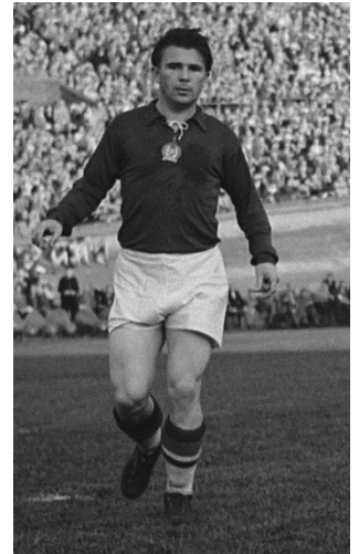
CC BY-SA 3.0

Am 19. Oktober entschlossen 8 sie sich, im Geschichtsunterricht eine Schweigeminute 9 abzuhalten, um ihres Helden zu gedenken. Ihr Lehrer war davon sehr überrascht und meldete das Schweigen dem Schuldirektor. Der Schulleiter 10 wollte den Vorfall 11 als Streich 12 abtun. Andere Lehrer informierten aber Parteimitglieder 13 . Volksbildungsminister Lang drohte der Klasse mit Schulverweis 14 , wenn der Rädelsführer 15 nicht in einer Woche bekannt wäre. Aber die Klasse blieb standhaft und weigerte 16 sich trotz Erpressungsversuchen 17 und mehrmaligen Verhören 18 , einen Namen zu nennen.